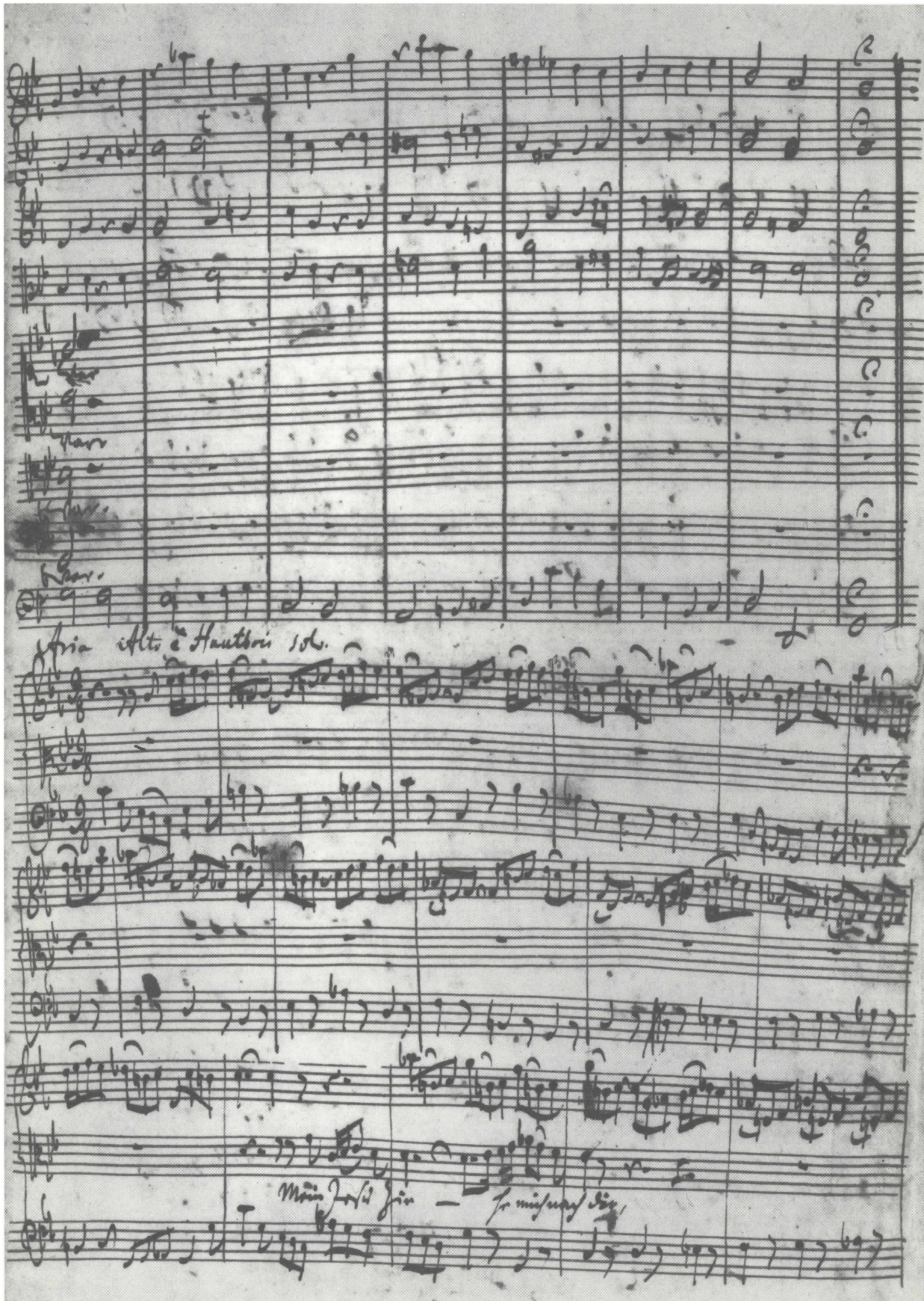
Kantate Jesus nahm zu sich die Zwölfe , BWV 22. Bl. 4 r der autographen Partitur (Saatsbibliothek zu Berlin, Preußischer Kulturbesitz, Mus. ms. Bach P 119 ). Schluß des 1. und Anfang des 2. Satzes. Originalgröße: 36 × 23 cm